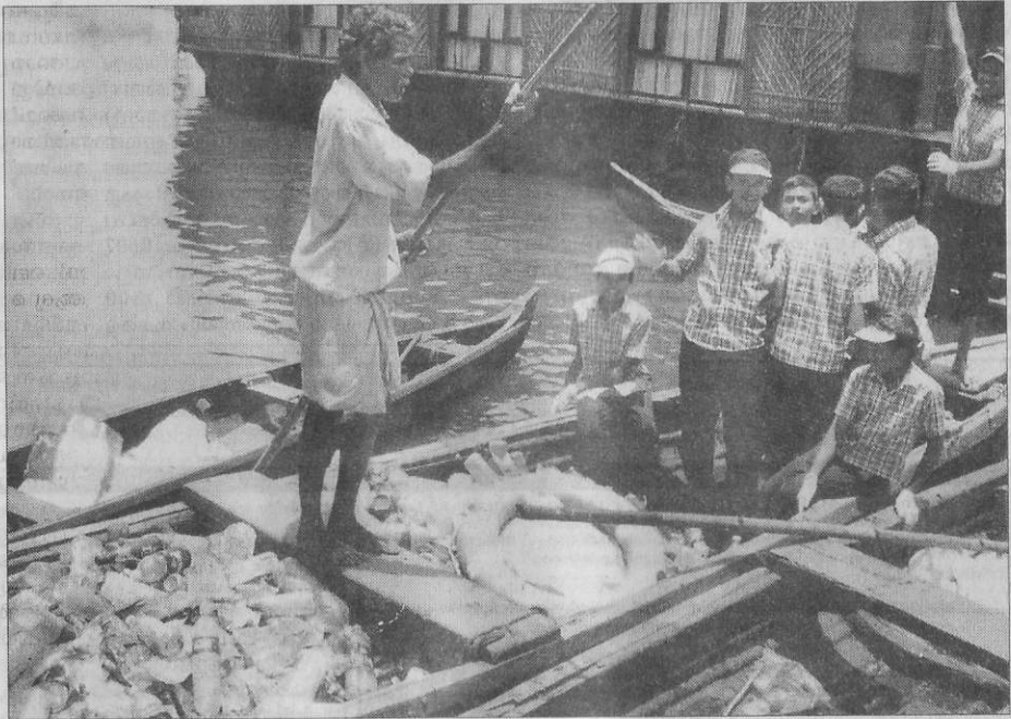
പുനനമടക്കായലിലെ പ്ലാസ്റ്റിക് മാലിന്യങ്ങൾ വള്ളത്തിൽ ശേഖരിച്ചുകൊണ്ടുപോകുന്നു

അധ്യാപകർ, ടൂറിസം പോലീസുകാർ എന്നിവരും മാലിന്യം നീക്കാൻ മുന്നിട്ടിറങ്ങി.